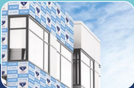
SURFACE PROTECTION حماية الاسطح