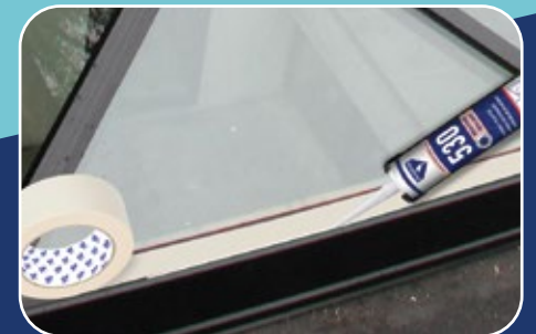
MASKING BEFORE SEALANT APPLICATION