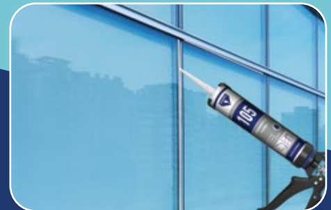
CURTAIN WALL SEALING عزل زوايا الزجاج