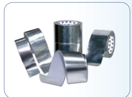
شريط لاصق ألومنيوم