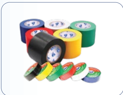
شريط لاصق عازل (PVC)