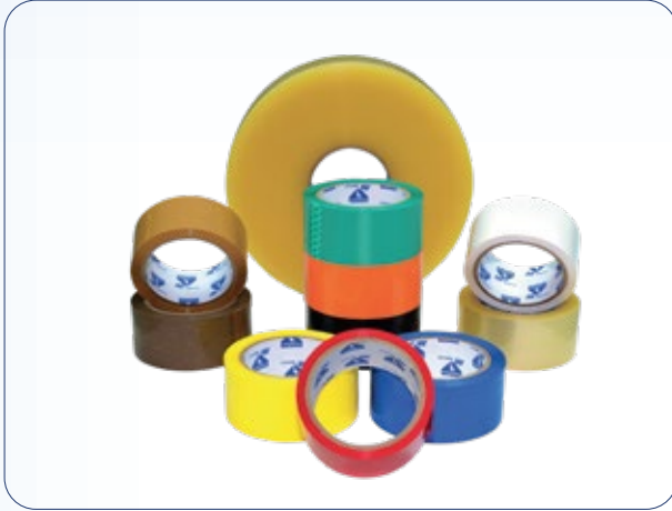
شريط لاصق للتغليف (BOPP)