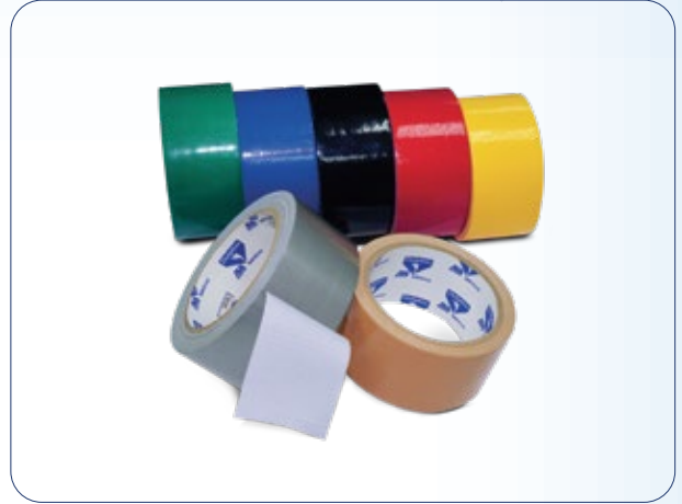
شريط لاصق نسيجي (أنابيب التهوية)