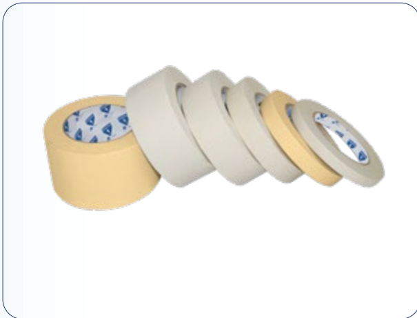
شريط لاصق ورقي