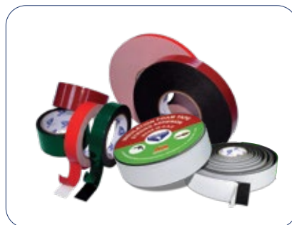
شريط لاصق فوم